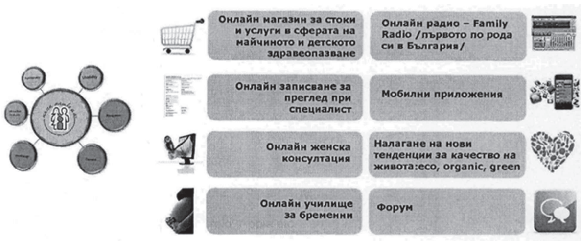
Фиг. 2. Функционалности на портала

Електронният портал „Мама, татко и аз“ привлича за свои партньори водещите здравни заведения в областта на майчиното и детското здравеопазване: Първа АГ болница „Св. София“, II САГБАЛ „Шейново“, Университетска болница „Майчин дом“ - София, и Специализирана болница за активно лечение на детски болести - София. За разлика от други портали, където информацията се споделя от неспециалисти, „Мама, татко и аз“ дава мнения на истински лекари-специалисти. Целта е компетентна информираност на потребителя, без обаче да бъде изместен истинският преглед!