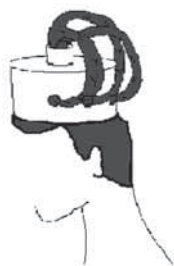
Рис. 2. Головной убор девушки.

Наряду с этим, у кочевых народов, головной убор иногда имел сложное сооружение, причем с возможностью подчеркивания красоты густых женских волос, которые не скрывались, в отличие среднеазиатских, а выставлялись на показ (Рис.2). Степняки носили островерхий малахай, а алтайцы - плоскую круглую шапочку [5].