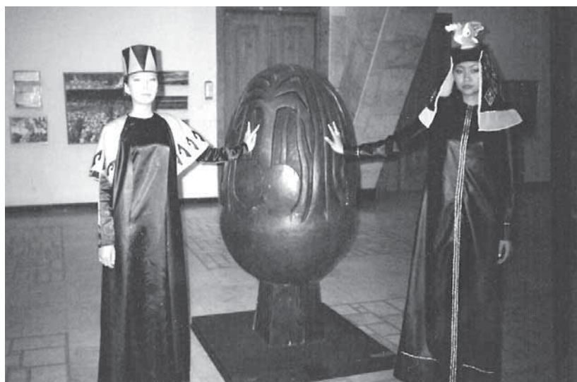
Рис. 3. Костюмы из коллекции.