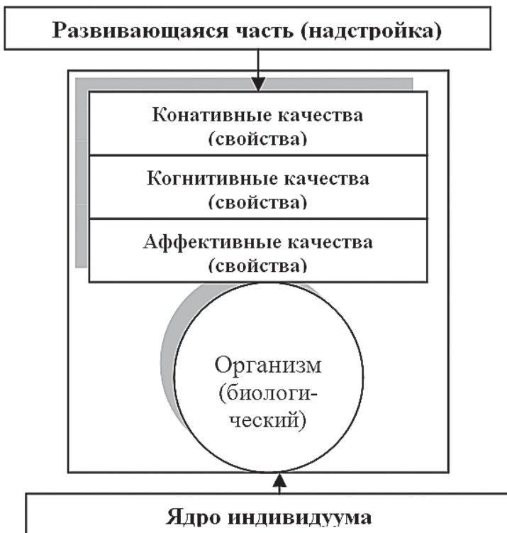
Рис. 1. Представление структуры исследуемого объекта «индивидуум» в органистической концепции развития

Аналогичным образом формируется структура групповых и массовых «организмов». Для «группы» ядром является «индивидуум», для «массы» - группа. Их надстройки формируются путем декомпозиции базового 3-х уровневой спектральной структуры индивидуума на