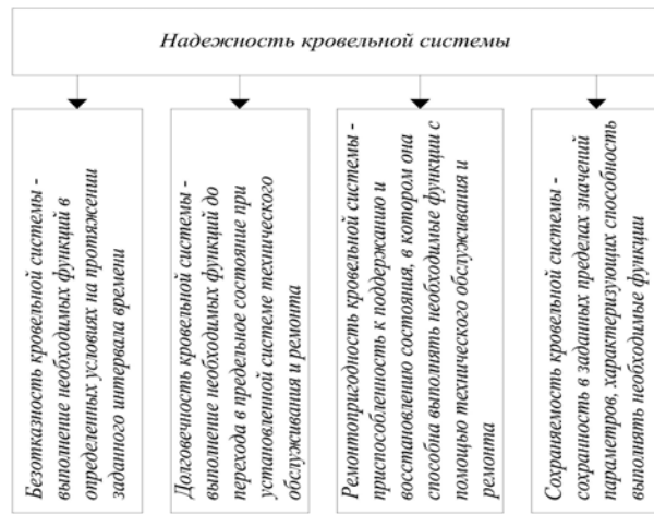
Рис. 1. Факторы, формирующие надежность кровельной системы