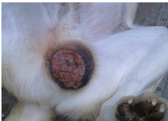
Figure 4. Ulcer at the scrotal level of patient with suspicion of cutaneous leishmaniasis.

When there is a suspicion that a canine has leishmaniasis, the basic tests are blood count, a biochemical hepatic or renal profile as well as