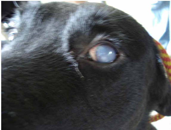
Figure 3. Ocular manifestations in canine with suspicion of visceral leishmaniosis.

úlceras (en algunos casos parecidas a úlceras por decúbito) (Figura 1), alopecia en algunas zonas, esplenomegalia (Figura 2), epistaxis, emaciación progresiva (aun cuando el paciente no ha perdido el apetito o el alimento es de buena calidad), lesiones oculares resultado en la mayoría de las veces por reacciones de hipersensibilidad tipo IV (uveítis, conjuntivitis, queraconjuntivitis, blefaritis) (Figura 3), insuficiencia renal, diarrea, hematuria, cojeras y onicogripos (crecimiento exagerado y anormal de las uñas), temperatura normal en unos casos y fiebre en otros, atrofia muscular, diferentes tipos de dermatitis (exfoliativa, nodular, pustular). De igual manera se pueden presentar lesiones articulares como poliartritis. (13, 14). En algunos caninos machos, se pueden observar úlceras a nivel escrotal (Figura 4).