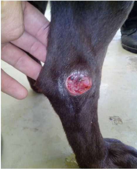
Figure 1. Ulcer in hind limb of patient with suspicion of visceral leishmaniosis.