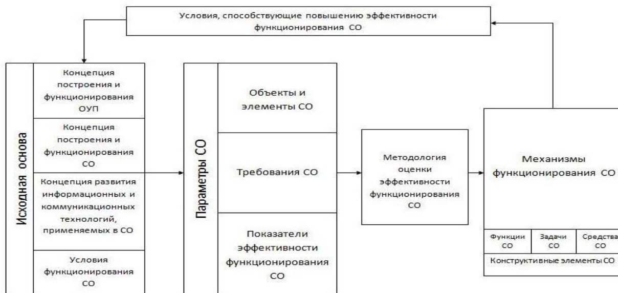
Рис. 1. Общая структура унифицированной концепции СО

Из приведенного рисунка видно, что исходной основой построения концепции являются: концепции построения и функционирования ОУП, концепции построения и функционирования СО, концепции развития компьютерных и информационных технологий применяемых в СО и условия функционирования СО. Исследование этих положений предлагаемой концепции в данной статье не приводится.