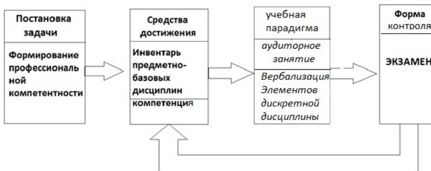
Рисунок 1 - Схема образовательного процесса при традиционном подходе.

С учетом изложенного, представим схему образовательного процесса при традиционном подходе.