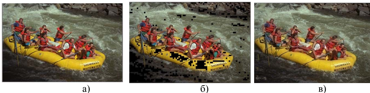
Рисунок 2 - Восстановление изображения Лодка .

На рисунке 2 представлен пример восстановления изображения «Лодка», а на рисунке 3 пример восстановления фрагмента изображения «Фрукты» (а – исходное изображение; б – изображение с отсутствующими блоками пикселей; в – изображение, восстановленное методом реконструкции).