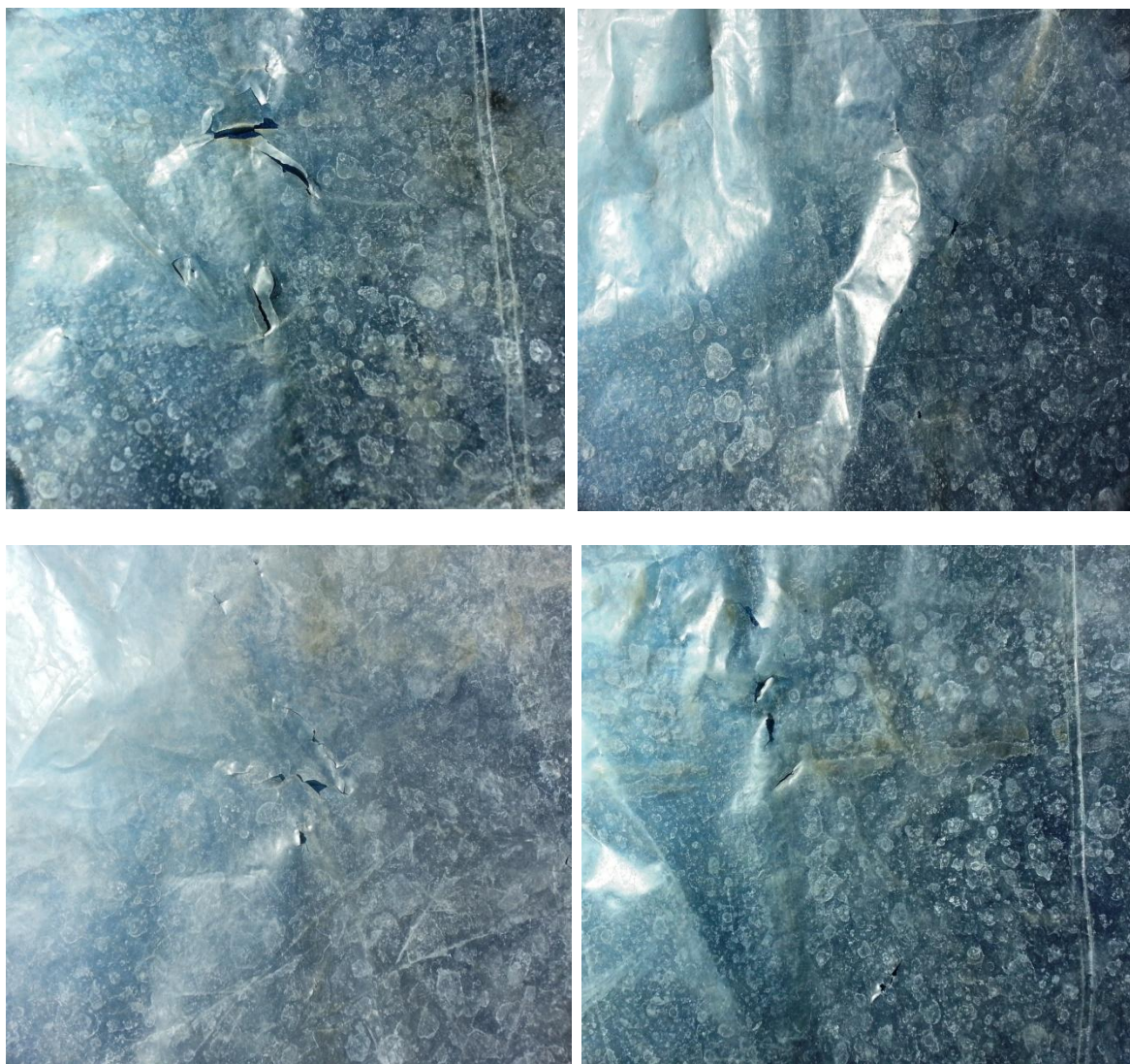
Рисунок 2 - Деструкция образцов без нагружения.

объединения плавающих дырок, может превышать скорость термодеструкции отдельных молекул, даже с учетом развития пористости материала. Именно этот процесс мы как раз и видим на наших образцах.