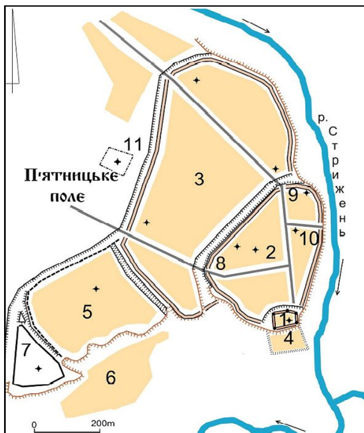
Рис.3. Чернігів у другій половині ХVІІ ст.: 1. Верхній замок. 2. Фортеця (Перший замок черкаський). 3. Форштадт (Другий замок черкаський). 4. Острог (Солдатська слобода). 5. Третяк. 6. Поділ. 7. Єлецький монастир. 8. Любецька (Київська) брама. 9. Погоріла (Лоївська, Миколаївська) брама. 10. Водяна брама. 11. П'ятницький монастир

Щодо укріплень Форштадту, то на плані 1757 р. відображені конструкції залишків його оборонних стін. Із західного боку проходила стіна з колод, що з боку міста трималися на перехрещених палях, які утворювали трикутні опорні конструкції, імовірно, заповнені землею. Такі конструкції являли собою різновид терас (рис. 2-Б). Вірогідно, що зверху цієї стіни прокладався бойовий хід із заборолами-банкетами. Аналогічна за конструкцією стіна була зафіксована ще в ХІХ ст. на Великому Красноярському острові (сучасне місто Красноярськ у Східному Сибіру), побудованому у 1660-1670-х роках, тобто синхронно з чернігівськими укріпленнями [3, с.286].