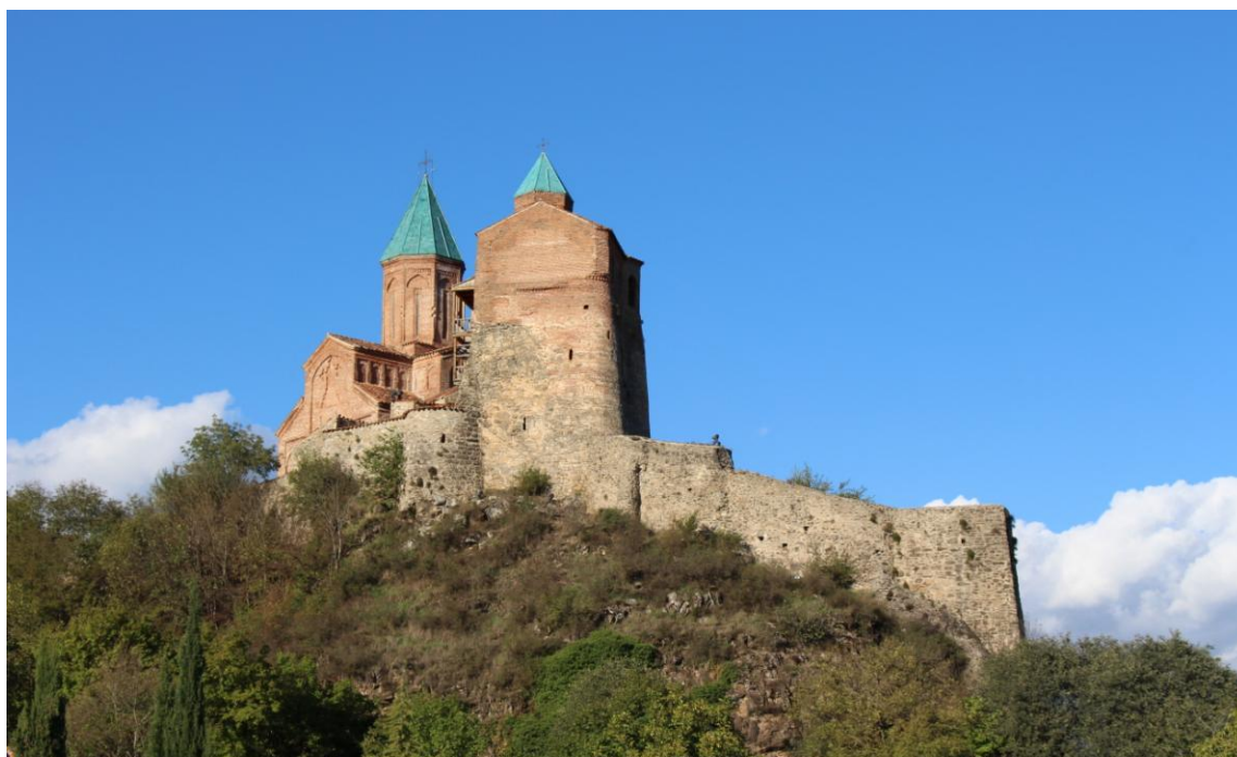
Фото 1. Царский замок и крепость Греми

Как ни странно, но при разделении единой Грузии начали возникать новые города. Наилучшей иллюстрацией здесь могут считаться Греми и базар (Дзагеми). Город Греми более того стал столицей Кахетинского царства в XVI–XVII веках. Основанная Леваном Кахетинским, столица была царской резиденцией и оживленным торговым городом Великого Шёлкового пути. Возникли новые политические центры и соответственно появились названия новых торговых мастерских.