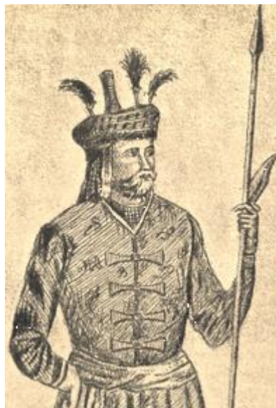
Рис. 1. Царь Кахетии Александр II

Царь Кахетии Александр II (1574–1605) с гордостью объявлял русским послам: «Правда, что моё королевство малое, но зато оно не бедное, дворян у меня много, также и воинов много вооружённых, не боюсь ни османов, ни татаров» [4, С. 184].