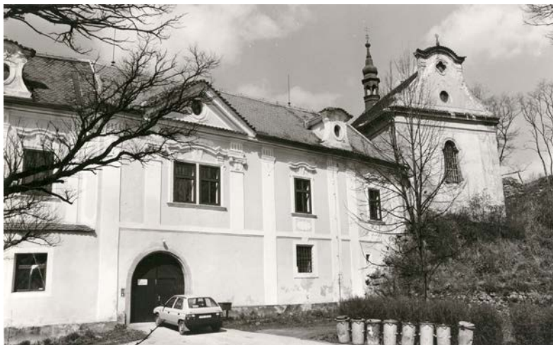
Obr. 5. STŘELA – vstupní čelo dolního hradu s bývalou hradní kaplí.