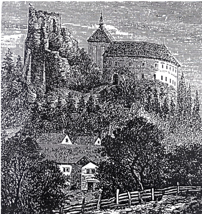
Obr. 4. STŘELA – hrad a zámek od západu na vyobrazení B. Kroupy (Světobzor 1869).