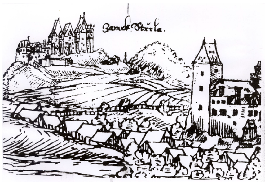
Obr. 1. STŘELA – hrad na pozadí prospektu Strakonice, dřevoryt J. Willenberga z r. 1601.

VOTÝPKOVÁ, E., 1933: Hrad a zámek Střela u Strakonice. Strakonicko. Propagace a adresář. Strakonice.