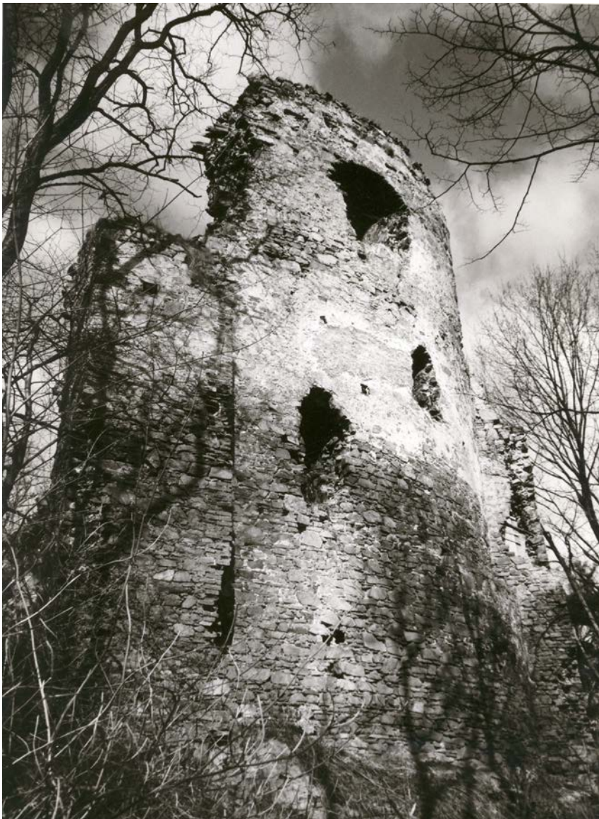
Obr. 6. STŘELA – fragment jihovýchodního obvodu horního hradu.