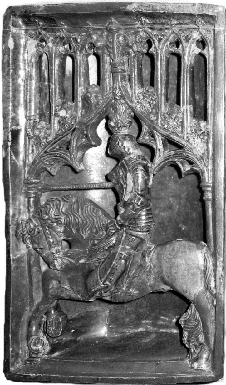
Obr. 2: Kachel typu 5/b z tzv. rytířských kamen, 1454–1457, expozice hradního muzea, Budapešť.