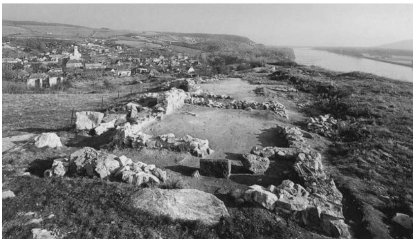
Obr. 5. Základy veľkomoravského kostola z výskumu MMB.