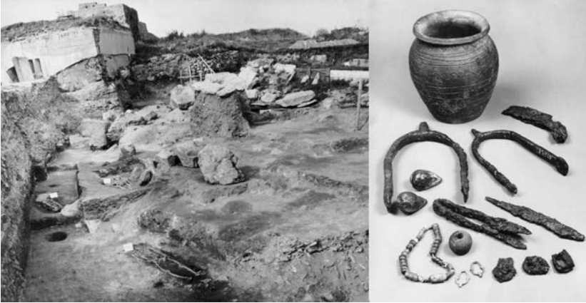
Obr. 8. Velkomoravské hroby a ich inventár.

lium quib' gestę requalitate munire nisi s' op posuerit. casq; litteris comprehensas in legati aplice suggererunt p'guntariū agripinę colonię & thiotgaudū treurensem gallię belgieę archiepōs meolao apostolicę sedis pontifici probandas tñs miserunt. qui conuocato romane sedis epōe con cilio. & mettensem anathematizauit synodiū. & ad semissos epōs de posuit & eōmumione priuauit iuste quidē & canonicę ut scriptis suis ipse testat. nuiste v' sic illi rescriptis & assertionib' firmare conantur. Scripturā autē utriusq; partis quisq; curiosus scire desiderat. In nōnullis germanię locis poterit inuenire. Dccc lxxiiii Ludouuicus rex mense augusto uli' danubium cū manu ualida pfectus rastičen inquadā ciui tate que lingua gentis illius douyina . i. puella dicit' obsedit. At ille cū regis copiis congregari non auderet. atq; loca sibi effugendi de negata cēneret. obsides q'les eq'mos rex pcepto necessi