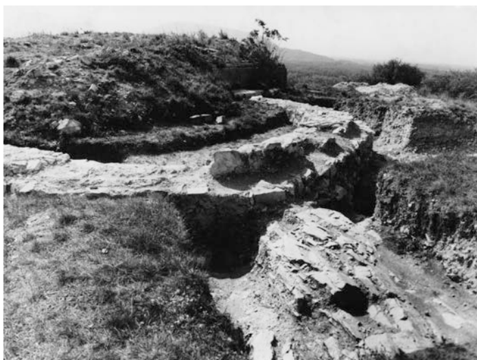
Obr. 11. Základy kruhovej kaplnky.