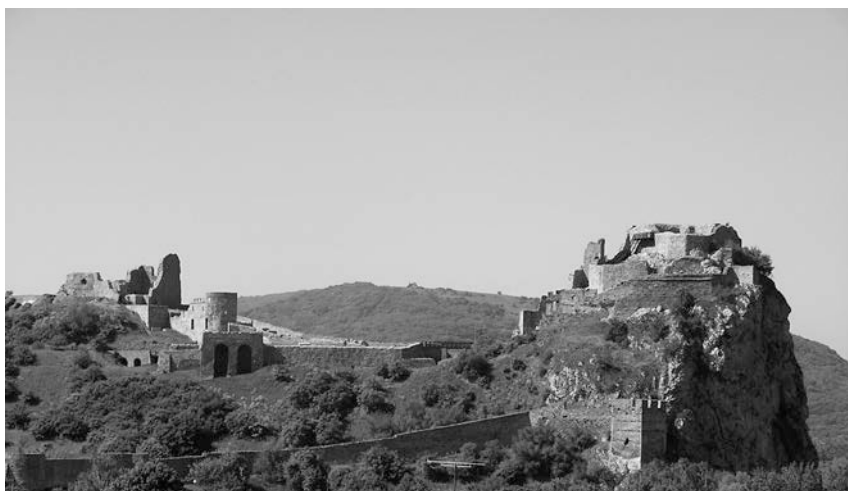
Obr. 1. Hrad Devín.

ZAVADIL, 1912 – J. Zavadil : Velehrady Děvín a Nitra, 1912.