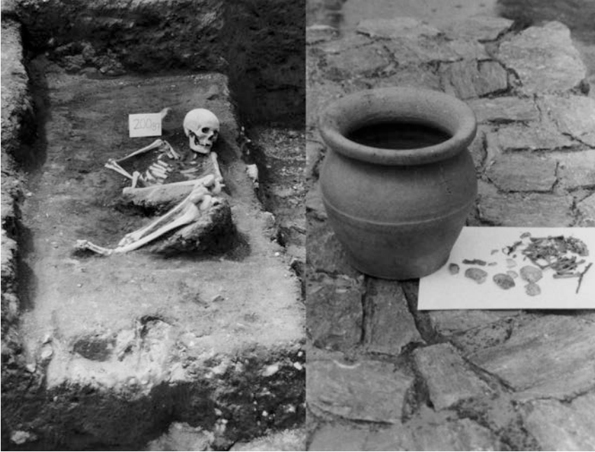
Obr. 12. Hrob skrčenca s inventárom.