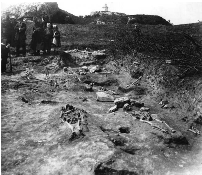
Obr. 3. Odkryté hroby cintorína z 11. – 13. storočia z výskumu I. L. Červinku (Fotoarchív MMB).