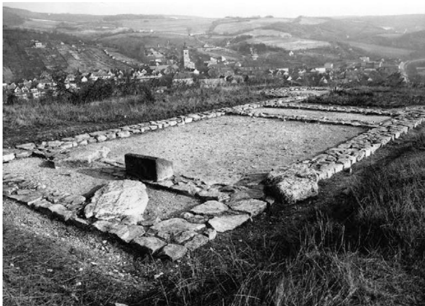
Obr. 4. Pôdorys architektúry považovaný za rímsky objekt z výskumu J. Eisnera.