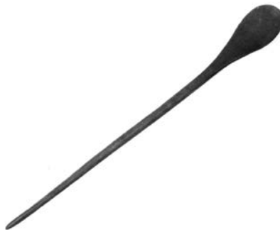
Obr. 7. Stylus.