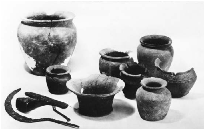
Obr. 2. Inventár slovanskej chaty z výskumu J. Dekana.