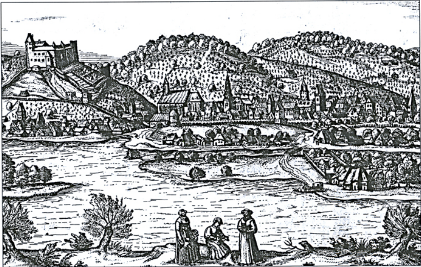
Obr. 1. Bratislava (rytina J. Hoefnagla, 1574).

ZACHAR, L. – REXA, D. 1988 : Beitrag zur Problematik der spätlatenzeitlichen Siedlungshorizonte innerhalb des Bratislavaer Oppidums. In: Zborník SNM História 28, 27–n.