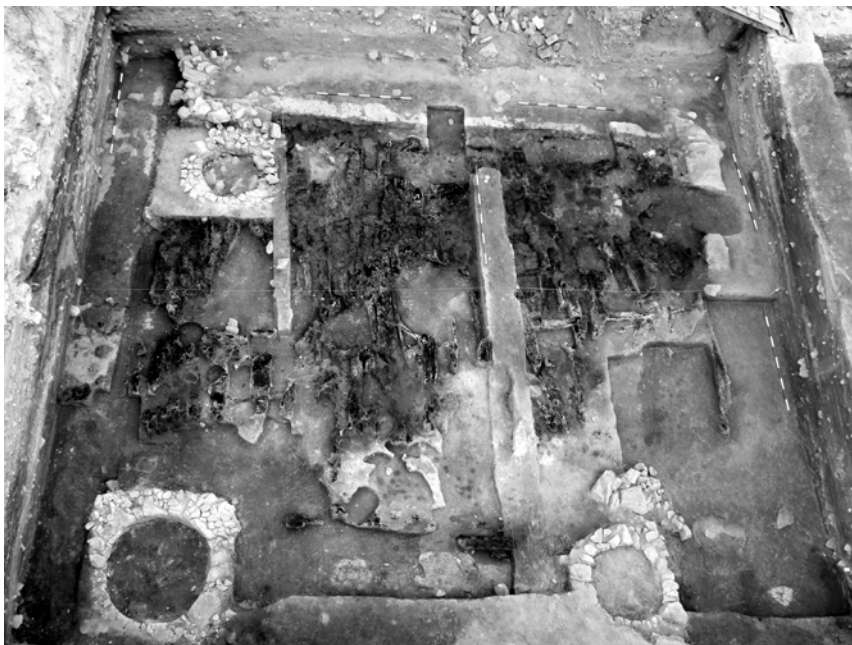
Obr. 3. Foto rozmernej drevenej stavby na južnom podhradí s neskôr zapustenými kruhovými studňami.