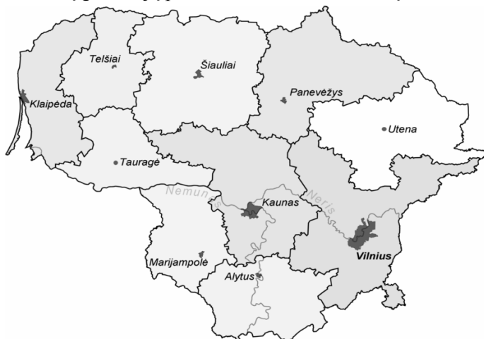
1 pav. Akredituotų gimnazijų profesinio informavimo taškų teritorinė atranka

Duomenys tyrimui buvo renkami 2011 m. rugsėjo – gruodžio mėnesiais. Iš viso internetinėse svetainėse peržiūrėta informacija apie 696 profesinio informavimo taškus pagal įstaigų tipus. Nagrinėjant įvairių įstaigų profesinio informavimo taškų pateikiamą informaciją, pastebėta, kad daugiausiai informacijos pateikia akredituoti PIT. Todėl buvo peržiūrėtos 307 akredituotos PIT darbo vietos pagal įstaigų tipus. Nustatyta, kad daugiausiai PIT akredituota gimnazijose. Gimnazijose akredituota 114 PIT. Atsižvelgiant į šią situaciją, tyrimui pasirinkta 114 gimnazijų akredituotų PIT. Peržiūrėta 114 gimnazijų interneto svetainių. Akredituotų gimnazijų profesinio informavimo taškų teritorinė atranka pavaizduota 1 pav.