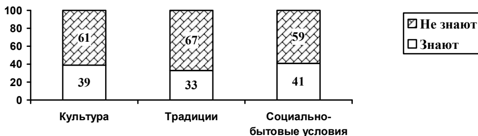
Рис. 1. Знания иностранных студентов.

В Республике Беларусь ситуация осложнена еще тем, что до сих пор в образовательном процессе для иностранных студентов воспроизводятся не только традиции Советского Союза, но и реалии Российской Федерации. Показательный пример: учебные пособия, которые традиционно используются в образовательном процессе на начальном этапе подготовки (доуниверситетское образование), когда закладывается основа для формирования мотивационных, социокультурных ориентаций иностранных граждан, имеют название «Дорога в Россию». Одним из следствий подобного состояния учебно-методического обеспечения образовательного процесса являются низкие темпы социокультурной адаптации иностранных студентов и, как результат, упущенные возможности для формирования специалиста, хорошо представляющего особенности экономической, социальной, культурной среды белорусского государства.