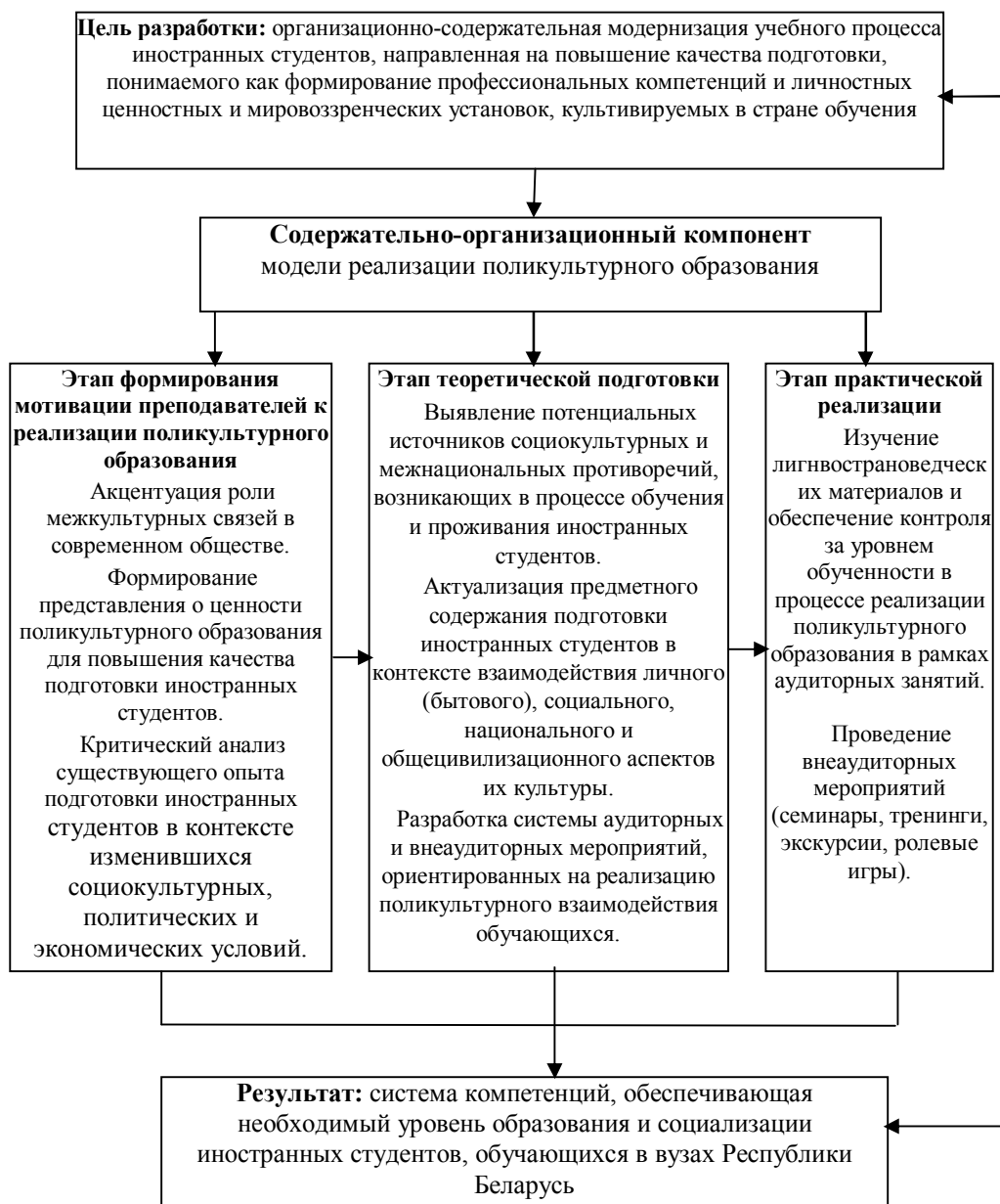
Рис. 2. Модель реализации поликультурного образования

Модель поликультурного образования апробирована на факультете доуниверситетского образования ведущих вузов республики (Дынич, Симака, Тихонов, 2007).