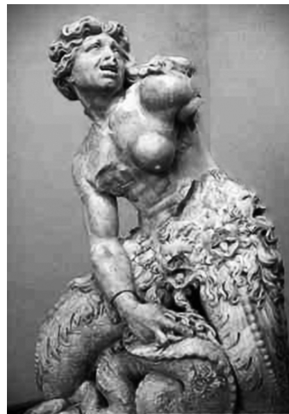
Рис. 2. Источник [4]