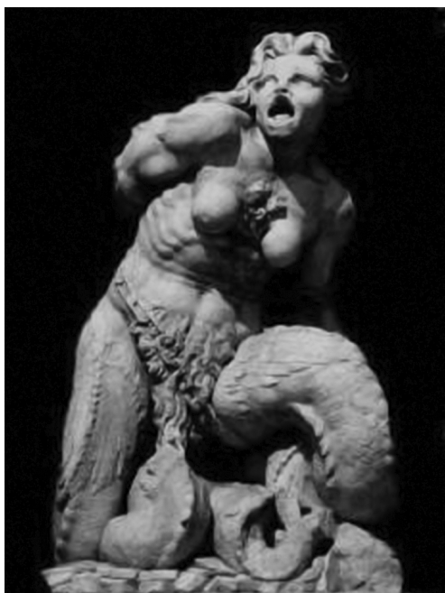
Рис. 3.

мальной усложненности композиционного решения (ведь не зря Вазари упоминает, что этот фонтан легче нарисовать, чем описать словами) до богатства подачи одиночных образов. Сам образ Нептуна исследователи обычно называют неудавшимся [7]. Зато очень показательными с точки зрения выражения маньеристического настроения, тяготения к уродливому, боли и отчаянию являются фигуры Сциллы (1557 г., рис. 2) и Харибды (1557 г., рис. 3), контрастирующие с глыбой покоя статичной вертикали Нептуна.