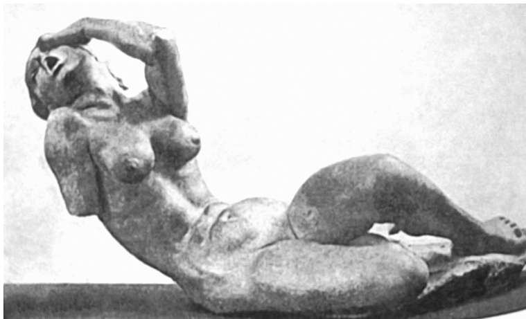
Рис. 4. Источник [2]

Разве на рубеже XIX и XX вв. те же ноты экспрессивного отчаяния, «приправленные» органической вписанностью в окружающий ландшафт, не повторяются в скульптурах А. Майоля («Ночь», «Флора», «Средиземное море»)? Трактовка образов, грубое, массивное тело женщины со слишком тяжелыми ногами, одутловатые формы, тяжелые пропорции – все это комплекс черт майолевской «Реки» (1939–1943 гг.), вновь воспроизводящий в памяти образ bozzetto работы Монторсоли. Но в контексте разговора о Майоле обычно не говорится о внутренней пусто-