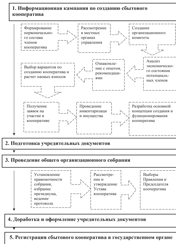
Рис. 2. Последовательность организационных мероприятий по созданию кооператива