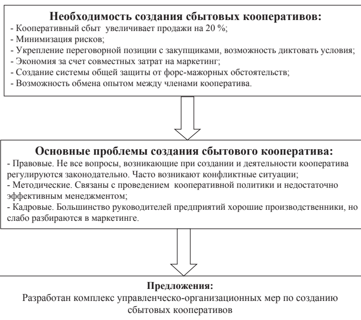
Рис. 1. Обоснование необходимости создания сбытовых кооперативов

Результаты исследований. Изучение международного опыта кооперативного движения, исследование возможности применения кооперации в развитии современного агропромышленного произ-