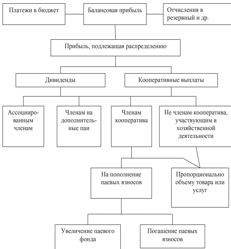
Рис. 4. Порядок распределения прибыли в сбытовом кооперативе