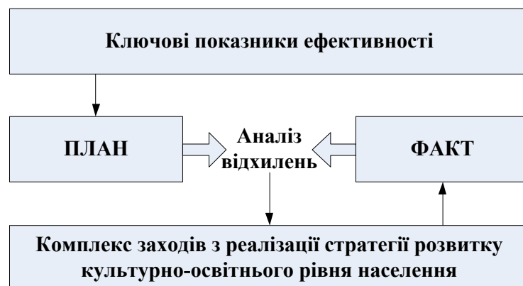
Рис. 2. Система моніторингу досягнення стратегії розвитку культурно-освітнього рівня населення

Реалізація функції контролю за процесом виконанням стратегії має починатися ще на етапі формування професійних намірів та продовжуватися до етапу професійної адаптації молодого фахівця. Інструментом контролю досягнення стратегічної мети є ключові показники ефективності. Звідси для кожного етапу реалізації стратегії розвитку культурно-освітнього рівня населення пропонується розробити ключові показники ефективності, які в своїй сукупності є інформаційною базою для системи моніторингу ступеню досягнення стратегії розвитку культурно-освітнього рівня населення. Суть цієї системи полягає в тому, що заплановані ключові показники ефективності порівнюються з фактично отриманими. Якщо відхилення між запланованими та фактичними показниками перевищує допустиме значення, то необхідно впроваджувати більш ефективні заходи з реалізації стратегії розвитку культурно-освітнього рівня населення (рис. 2).