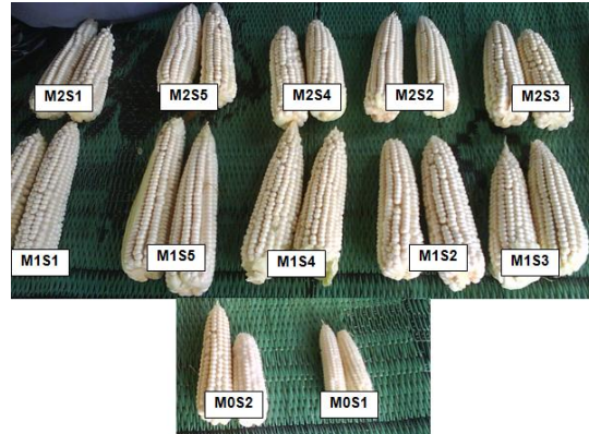
Gambar 3. Buah Jagung Kering Lahan Kecamatan Bayan

Perbedaan nyata tinggi tanaman terlihat pada masa vegetatif yaitu pada minggu ke-1 hingga ke-7 setelah masa tanam. Tanaman tertinggi adalah tanaman jagung yang diberi perlakuan