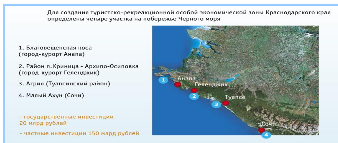
Рис. 2. Туристско-рекреационная особая экономическая зона Краснодарского края

Кроме того, в состав туристско-рекреационной особой экономической зоны Краснодарского края предполагается в дальнейшем включить отдельные территории Апшеронского, Темрюкского, Славянского, Ейского, Приморско-Ахтарского районов, городов Горячий Ключ и Новороссийск.