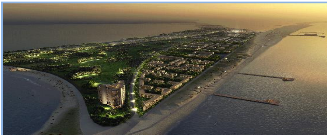
Рис. 3. Проект курортной зоны “Новая Анапа”

Графическое изображение проекта приведено на рисунке 3.