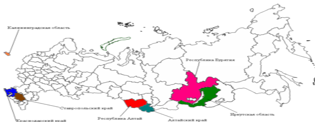
Рис. 1. Туристско-рекреационные особые экономические зоны в России

На рисунке 1 представлены субъекты РФ, в которых будут созданы ТР ОЭЗ.