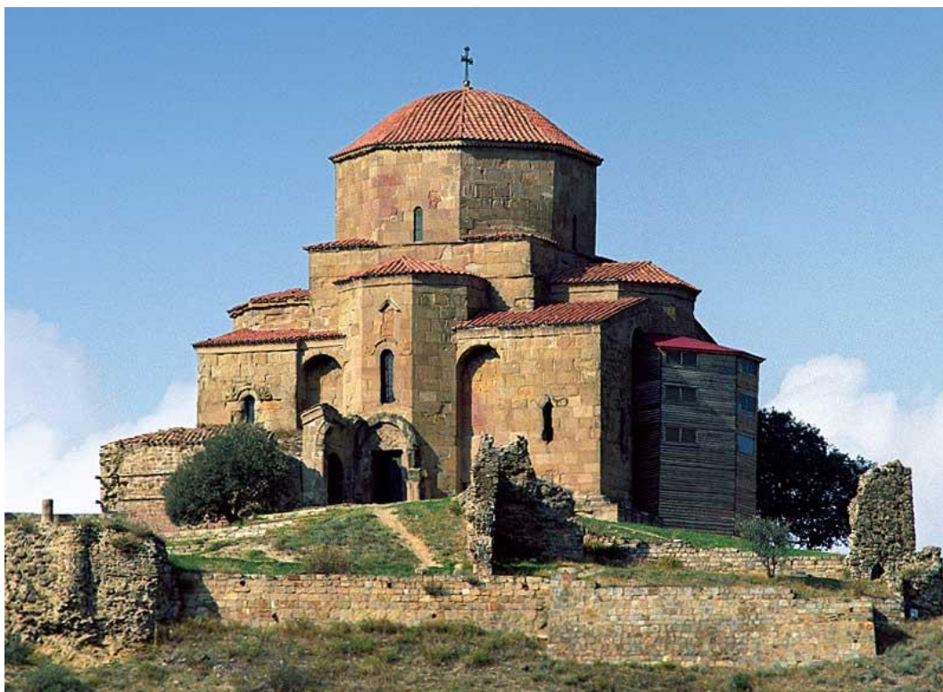
Фото 2. Монастырь Джвари, Грузия, Мцхета, монастырь VI в.

Архивные документы являются многосторонними, большое место уделено вопросу экскурсоводов, который и в настоящее время является весьма важным. «Во время тура экскурсовод – ведущая фигура, от него зависят способы повествования и показа объекта, главной целью экскурсовода должна быть передача материала в той форме, которая будет наиболее приемлемой для туристов» [6].