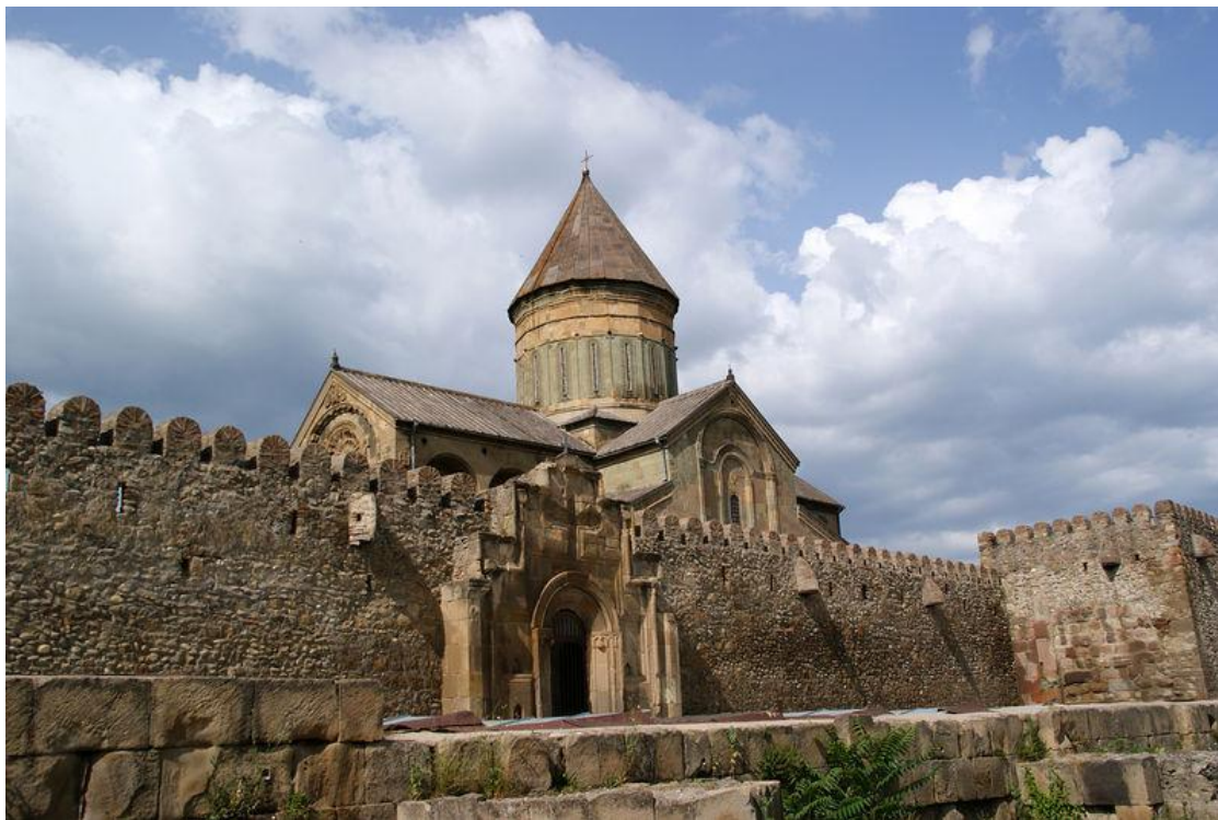
Фото 1. Мцхета. Собор Светицховели.

Эксперты по туризму предлагают нам следующее определение туристических баз: «... туристическая база – это туристический комплекс, в состав которого входят услуги, касающиеся принятия и размещения туристов, обеспечения их активного отдыха, а также служебные помещения: ресторан и столовая. Турбазы часто расположены в красивых местах, ущельях, на опушках леса [2]. Полстолетия назад туристическую базу характеризовали следующим образом: «Туристской базой называют учреждение туризма круглогодичного, летнего или комбинированного типа с регламентированным режимом дня, предназначенное для обслуживания туристов, которые путешествуют по маршруту преимущественно с путёвками» [3].