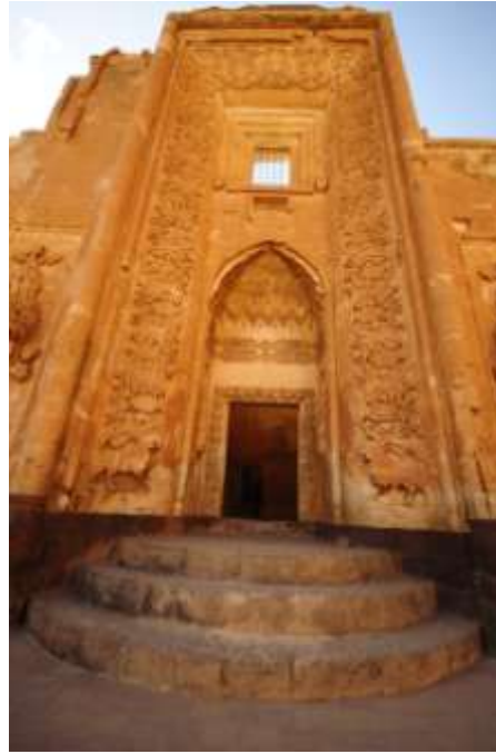
Fotograf 2 . İshak Paşa Sarayı Harem Taç Kapısı