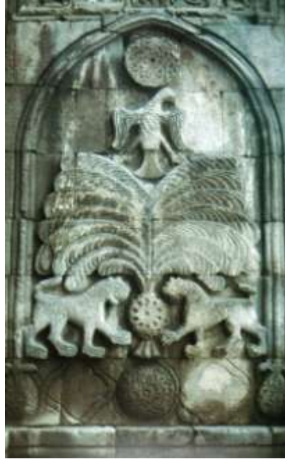
Fotograf 6 . Hayat ağacı motifi (Erzurum Yakutiye Medresesi)