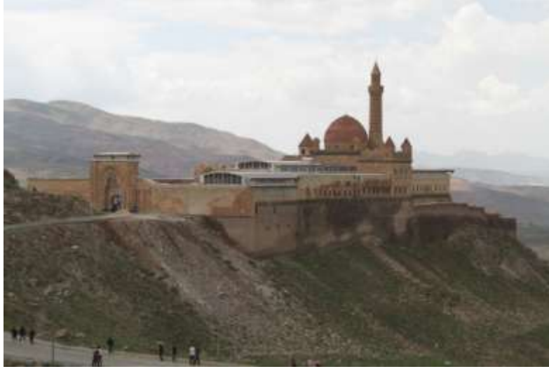
Fotograf 1 . Doğubayazıt İshak Paşa Sarayı genel görünüm

Sanatlarındaki geleneksel hayat ağacı motifleriyle kıyaslandığında saraydaki motiflerin çok farklı tarzda kullanıldığı görülür. XVIII. yüzyıl Osmanlı Dönemi yapısı olan İshak Paşa Sarayı'nda bulunan hayat ağacı motifleri, yapıldığı dönem özellikleri doğrultusunda, daha çok dekoratif özellik kazanarak bitkisel motiflerle birlikte, çiçeklerin kullanıldığı değişik kompozisyonlarla kullanım alanı bulmuştur. Ancak kesin sonuçlara varılamayan yapı dekorasyonunda uygulama alanı bulan bezemeler için belirli bir dönemden bahsetmek oldukça zordur. Sarayda yüksek kabartma olarak taşa uygulanan hayat ağacı motifleri, üsluplaşmış bitkisel motiflerle birlikte, geleneksel Selçuklu bezemeleri, XVIII. yüzyıl Avrupa barok, rokoko etkili motifler ve Gürcü, Kafkas kökenli bitkisel motiflerin bir arada kullanılmasıyla eklektik bir bezeme ortaya çıkmıştır. Ancak Avrupa'dan gelen barok, rokoko ve ampir etkili motifler İstanbul yapılarında gördüğümüz tarzdan çok farklı bir şekilde ele alınmıştır. Bunda bölgesel farklılıklarla birlikte mahalli ustaların etkilerinin olduğu ileri sürülebilir. Bu anlayış doğrultusunda sarayda bulunan hayat ağacı motifleri, kendine özgü yanı sıra tekrar edilmemiş başka bir yapıda karşılaşmadığımız bezemeler arasında gösterilebilir.