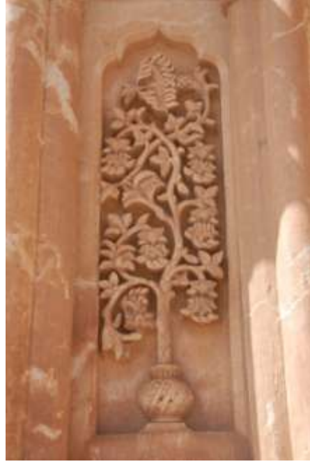
Fotograf 3. Türbe gövdesinde bulunan hayat ağacı motifi