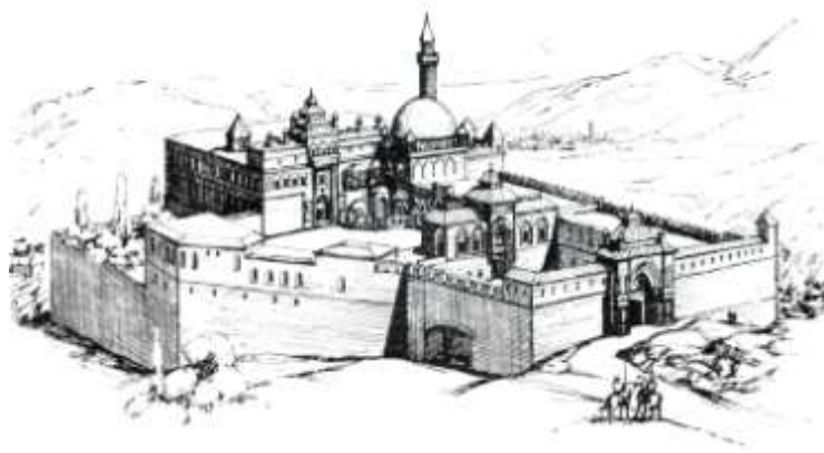
Çizim . 2 Doğubayazıt İshak Paşa Sarayı, Röleve ( M. Akok'dan)