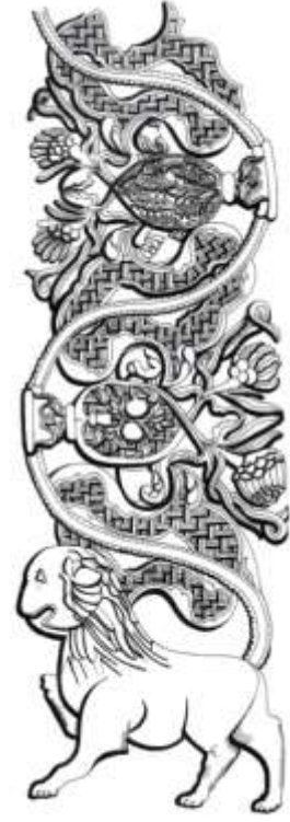
Fotograf 5 . Çizim 4 . Harem Taç kapısını çevreleyen bordür (Hayat ağacı motifi)