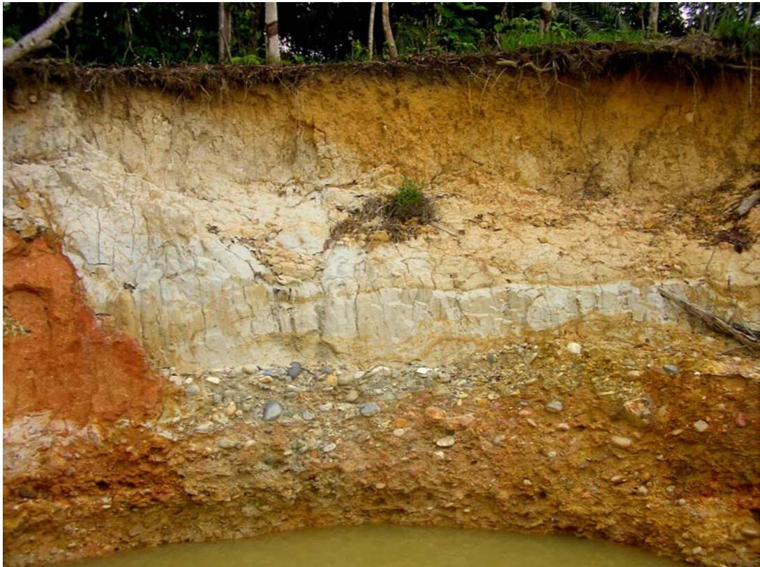
Gambar 3. Endapan point bar mengandung zirkon, emas, magnetit, dan ilmenit bagian dari aluvium purba di wilayah penambangan emas rakyat Desa Nanga Sangan, Kecamatan Boyan Tanjung, Kabupaten Kapuas Hulu, Kalimantan Barat (Tim Konservasi Kapuas Hulu-PMG, 2006).

warna bervariasi, bentuk butir menyudut tanggung dengan volume kandungan zirkon umumnya <7% dan dapat mencapai hingga 34,48% dari volume total konsentrat. Sama halnya dengan yang terjadi di Kabupaten Sanggau, bahwa zirkon dalam placer di wilayah ini diduga merupakan hasil rombakan batuan sumber granit dan tonalit berasal dari Pegunungan Schwaner.