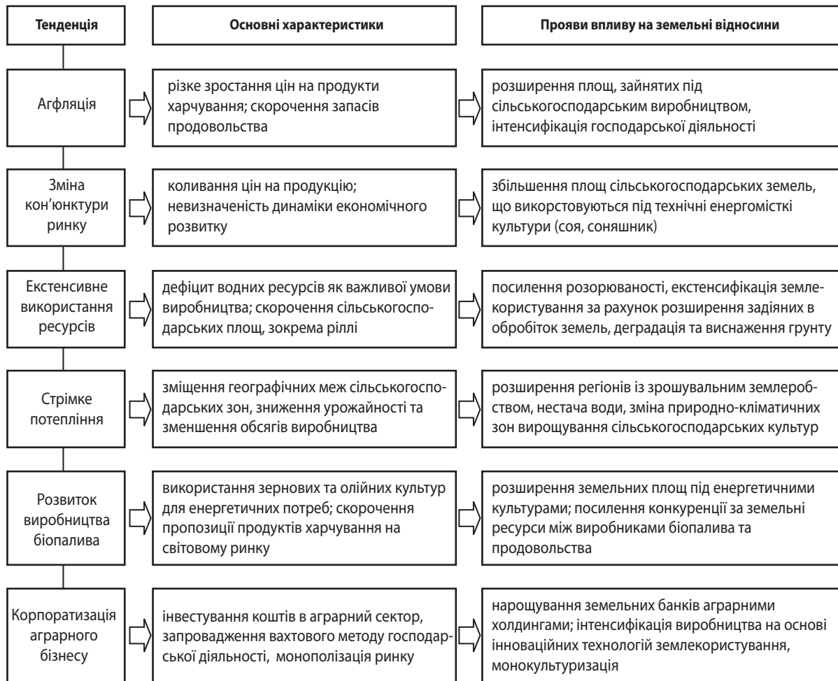
Рис. 1. Тенденції розвитку сільського господарства в умовах глобалізації