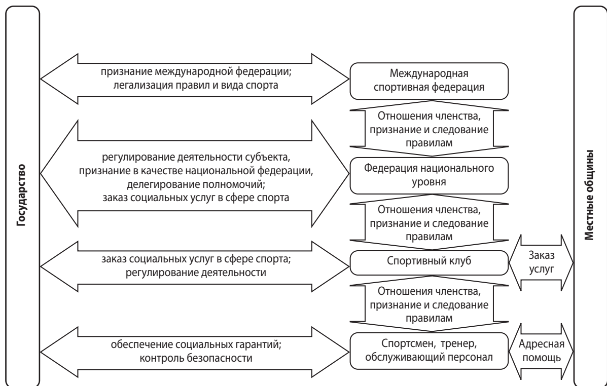
Рис. 4. Институциональная модель реформированной сферы спорта в Украине