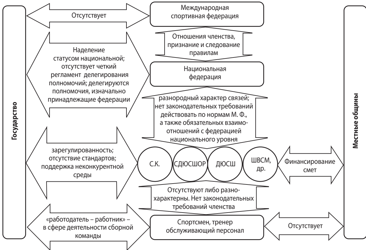
Рис. 2. Модель существующих институциональных отношений в сфере спорта

Выводы и направления дальнейших исследований. Существующая модель институциональных отноше-