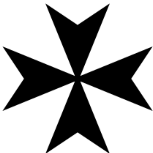
Рис. 3. Мальтийский крест.