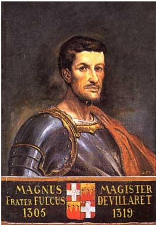
Рис. 2. Портрет Великого магистра Фулька де Вилларэ (1305–1319)

На аверсе серебряных монет был изображён Великий магистр, стоящий на коленях и сложивший руки перед крестом, что символизировало смирение и мольбу о прощении. Великий магистр одет в простую одежду и без обуви, а на левом рукаве вышит «Мальтийский крест» – восьмиконечный крест (Рис. 3).