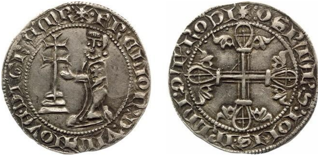
Рис. 1. Серебряный грош, отчеканенный в Мальтийском ордене (1305–1319)