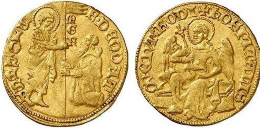
Рис. 4. Золотая монета Дьёдонне де Гозон (1346—1353)

Именно на острове Родос началась серебряная монетная чеканка, а примерно через 50 лет после началось изготовление золотых монет Ордена (Рис. 4), чеканка этих монет велась по образцу цехина из Венеции.