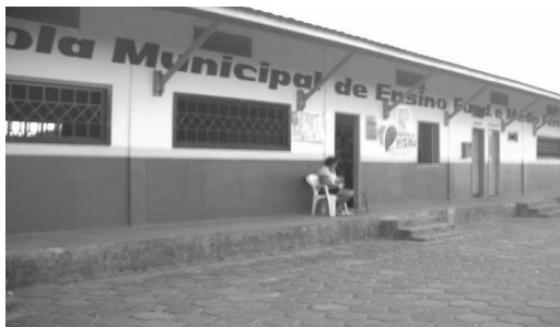
Figura 1 - Escola Municipal de Ensino Fundamental Fernandes Belo.

A Escola Municipal de Ensino Fundamental Fernandes Belo foi construída no ano de 1963 e chamou-se inicialmente de Escola Estadual de 1º grau Alceu Cavalcante, ofertando apenas a primeira etapa do nível fundamental (1ª a 4ª série), razão que levou muitos jovens a repetir a 4ª série até quatro ou cinco anos, por não dispor de um poder aquisitivo que lhe permitissem continuar os estudos na cidade, haja vista que não havia no local escola que ofertasse maior nível de escolarização.