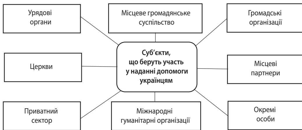
Рис. 2. Суб'єкти, що беруть участь у наданні допомоги українцям

За першим напрямом – «Гроші» – передбачені щомісячні виплати по 2 тис. грн кожній особі, що переїхала із зон активних бойових дій та 3 тис. грн на