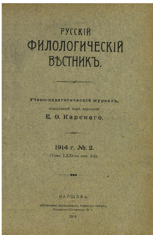
Рис. 2. Обложка «Русского филологического вестника» за 1914 г. № 2