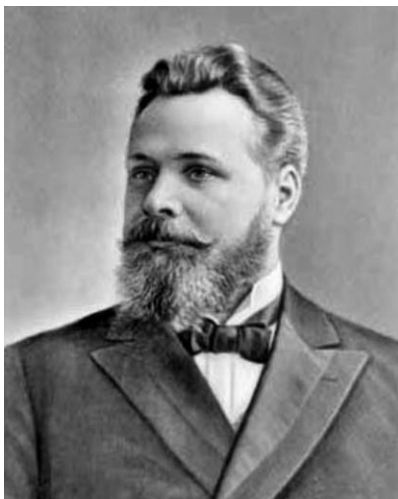
Рис. 3. Ефим Федорович Карский (1860–1931 гг.) – третий редактор «Русского филологического вестника»

С 1902 г. – декан историко-филологического факультета, а с 1905 г. последний редактор «Русского филологического вестника» (Чарота, 2013: 357-360).