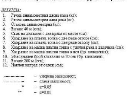
Фиг.1. Модел на корелационни зависимости между ръста и двигателните качества на деца от IV^{-ra} подготвителна група — първо изследване