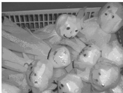
2 pav. Žaislai iš buitinių atliekų

Kiekvienas vaikas, darydamas priemones iš buitinių atliekų, atranda kažką naujo, tyrinėja, eksperimentuoja, aktyviai ieško įvairių kūrybinės veiklos būdų. Prieš darydami priemones, žaislus, vaikai ieškojo idėjų enciklopedijose, dailės darbėlių knygose. Vėliau