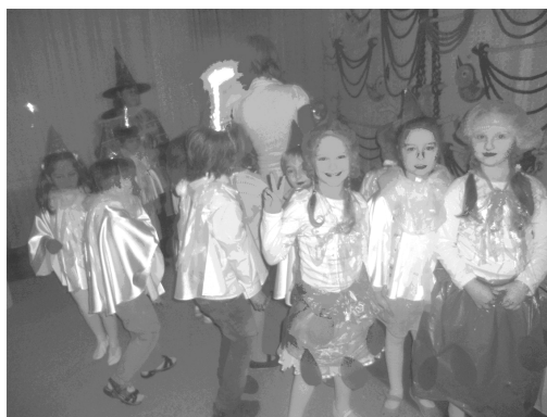
3 pav. Atvira pažintinė veikla tėveliams

Vaikai demonstravo tėveliams, kaip geba rūšiuoti atliekas, kaip išskirstomas plastikas, popierius, stiklas. Kiekvienas daiktas keliavo į tam skirtą dėžutę, prieš dėdami dar kartą vaikai aptarė, iš kokios medžiagos tie daiktai pagaminti. Tėveliams buvo pademonstruota, kad rūšiuojamos visos buitinės atliekos: popierius, plastikas, stiklas (žr. 4 pav.).