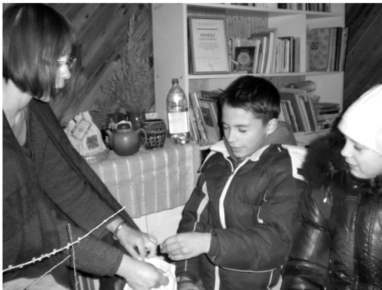
2 pav. Apsilankymas Prienų muziejuje