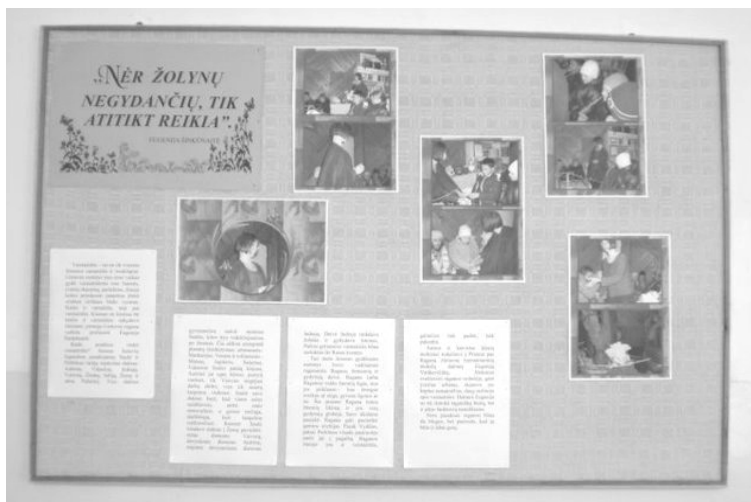
3 pav. Stendas apie vaistažoles

Grįžę rinkome mįsles apie vaistinius augalus, iliustravome jas. Išleidome du stendus: vieną piešinių, kitą pavadino Eugenijos Šimkūnaitės žodžiais „Nėra žolynų negydančių, tik atitikt reikia“ (3 pav.).