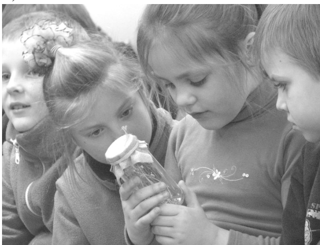
5 pav. Patys mažiausi mokyklos mokiniai apžiūrinėja vaistažoles

Vaistinės vedėja papasakojo apie įvairius vaistinius augalus. Sužinojome daug naujo apie, rodos seniai pažįstamus augalus. Taigi žemuogė pasirodo ne tik skani uoga, bet ir puikus vaistas širdies ir kraujagyslių ligoms gydyti. Čiobrelis – visai ne žolė, o puskrūmis ir jis ne tik maloniai kvėpia, bet ir tinka gydyti kosulį. Čiobreliais ir labai skaniomis uogomis – avietėmis sėkmingai galima gydyti peršalimo sukeltas kvėpavimo takų ligas. Kai nuo mokslų pavargsta akys, į pagalbą atskuba dar viena ne mažiau skani uogelė – mėlynė. Taip pat sužinojome, koku metu ir kokiai mėnulio fazei esant reikia rinkti vaistažoles.