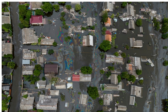
Slika 2. Ekološka katastrofa Nova Kahovka, detalj zagađenja iz vazduha 3

A inflacija, koja je na globalnom nivou iznosila u proseku 8,7%, u 2022, u 2023. bi mogla da padne samo za nešto više od jedan procentni poen, odnosno na 7%. To je i dalje visoka cenovna nestabilnost, koja može da vodi novim tržišnim poremećajima a iz monetarne sfere da se prelje u realnu. Pojednostavljeno rečeno prosečni rast cena životnih dobara iznosi blizu dvocifrenog! A to znači da će se veoma brzo otvoriti sistemski i organizovani napori sindikata i drugih asocijacija zaposlenih za indeksaciju zarada i to tako da se nominalne zarade povećavaju iznad inflacije, što sigurno vodi u stagflaciju. Ova pak dalje obara kupovnu moć nominalnih zarada i podriva elementarno poverenje u ekonomski sistem, poreze, novac i uopšte u industrijske odnose. Demonstracioni efekti dalje dovodi do zahteva za povećanjem zarada i tamo gde nema nikakvog osnova u niskoakumulativnim i niskoproduktivnim poslovima.