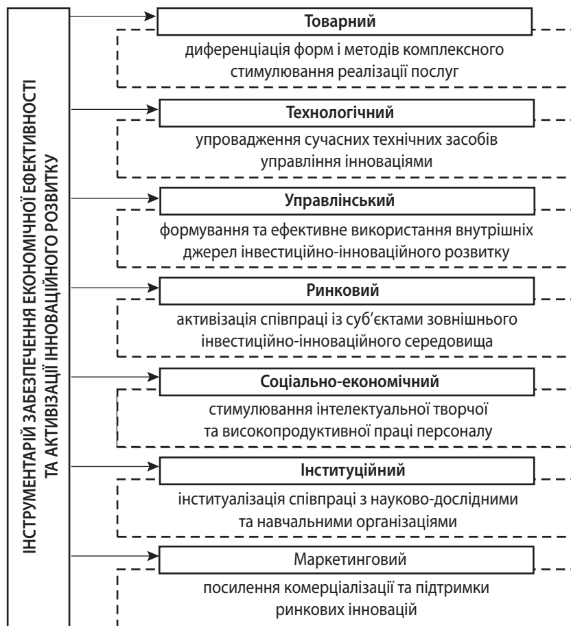
Рис. 2. Інструментарій забезпечення економічної ефективності та активізації інноваційного розвитку підприємств сфери послуг