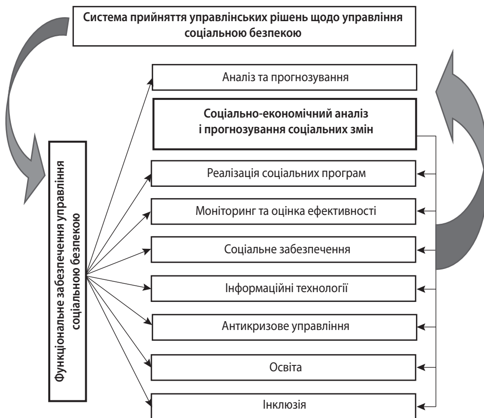
Рис. 2. Прийняття управлінських рішень на локальному рівні щодо забезпечення соціальної безпеки