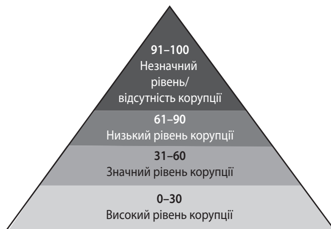
Рис. 1. Шкала оцінки рівня Індексу сприйняття корупції

Інші п'ять досліджуваних країн, а саме: Словаччина, Україна, Румунія, Молдова та Чехія, по-