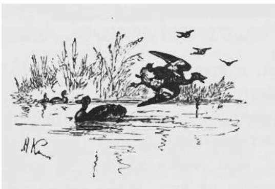
Рис. 1. Заключительная виньетка 5 очерка. Художник Н. Каразин

Основной общий сюжет заключительных виньеток 5 и 7 очерков – стилизованные пейзажи. Художник Н. Каразин использует изображение уток на воде, художник А. Писемский – изображение бурелома с элементом окружности, которая может символизировать лупу исследователя или сферическую форму как единую форму для природных объектов. Эти изображения достаточно универсальны, не имеют явных локальных особенностей, они могли бы иллюстрировать большое количество очерков, где даны описания леса, водных источников, различных территорий (как безлюдных, так и обитаемых). Данные визуальные образы, скорее всего, создавались как обобщенные иллюстрации, которые могли иметь широкое издательское применение.