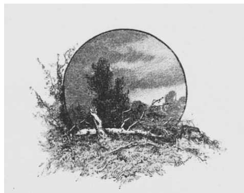
Рис. 2. Заключительная виньетка 7 очерка. Художник А. Писемский

Таким образом, визуализация исторических, географических, этнографических, бытовых, в том числе религиозных, особенностей Восточно-Сибирских территорий была выполнена достаточно обширно, она имела как иллюстрирующие, так и научно-познавательные функции. Для визуализации содержания 1 части 12 тома издания «Живописная Россия» в целом характерен