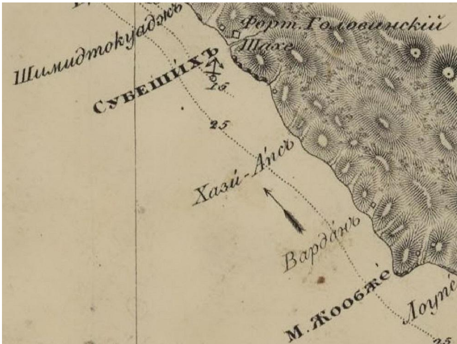
Рис. 1. Карта восточного берега Черного моря. 1834.

После боя к генерал-лейтенанту Раевскому обратились парламентареры-убыхи из авторитетных фамилий Биарслан, Берзек и Тюльпар (Тюлькар), которые хотели выкупить тела убитых соплеменников. Раевский объяснил убыхам, что мертвыми он не торгует, и они забрали с собой двух убитых собратьев (Лавров, 2009: 123).