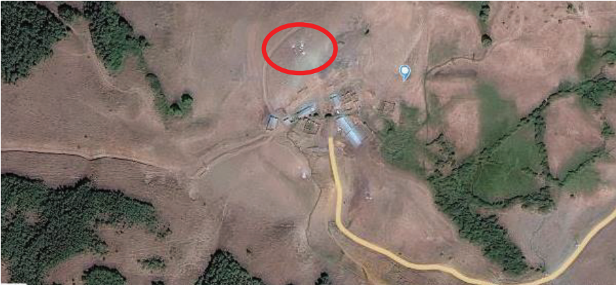
Şekil 1: Kureyşli Sarıkaya Köyü uydu görüntüsü ( https://www.ilcelerikoyleri.com/koy/erzincan-uzumlu-kureyslisarikaya-koyu-17159 )

Bu çalışmada, aşiretin inanç ve değerler birliğini oluşturan Alevilik ve aşirete tabii kişilerin mezar ve mezar taşlarındaki bezemelerin Alevi geleneği ve Anadolu Türk sanatındaki yeri değerlendirilecektir.