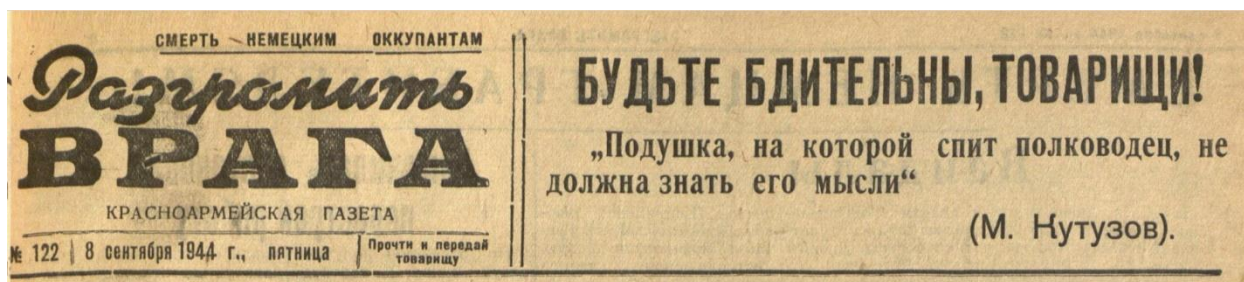
Рис. 1. Первая страница газеты «Разгромить врага». 1944

На первой странице газеты в шапке размещался девиз «Смерть немецким оккупантам», указывалось название газеты с пояснением, что это красноармейская газета, и далее следовали выходные данные (порядковый номер издания, дата и день недели), далее следовала памятка – «Прочти и передай товарищу». В правой части газеты, напротив сведений о газете, публиковались цитаты известных российских военачальников, в данном случае фельдмаршала М. Кутузова: «Подушка, на которой спит полководец, не должна знать его мысли».