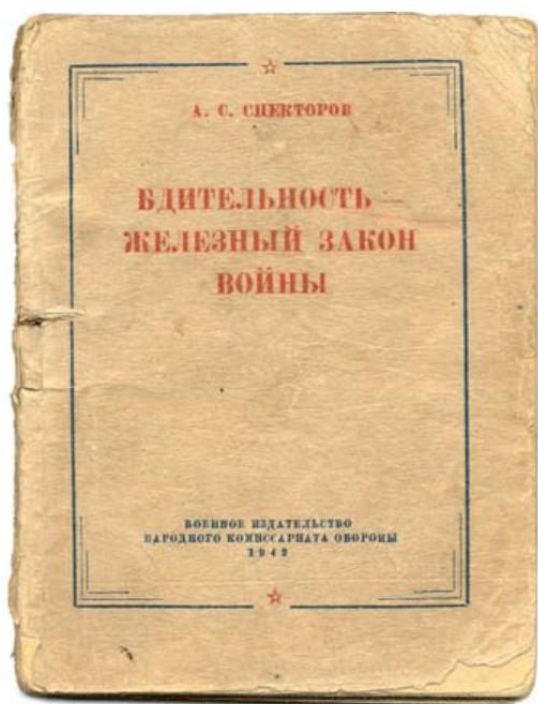
Рис. 2. Брошюра А.С. Спекторова «Бдительность – железный закон войны». М., 1942.

Уже в следующем номере (№ 123 за 9 сентября 1944 г.) публиковались материалы из брошюры А. Спекторова «Бдительность – железный закон войны» ( Рисунок 2 ), которые назывались «Ротозей и болтун – пособник фашиста». Публикация сопровождалась лозунгом «Болтун находка для шпиона» на всю ширину станицы газеты ( Рисунок 3 ). В этих материалах отмечалось: «Иногда военная тайна становится достоянием немецко-фашистской разведки из-за преступно-халатного отношения военнослужащих к хранению секретных документов. Забывчивые и легкомысленные люди носят при себе важные документы, которые затем теряют, либо их выкрадывают. Уходя из штаба, кабинета, блиндажа такие ротозеи оставляют на столах или в незапертых несгораемых ящиках оперативные карты. Иногда карту просто оставляют висящей на стене. Все это – находка для шпиона.