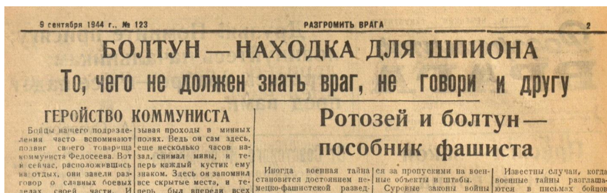
Рис. 3. Лозунг «Болтун – находка для шпиона» на странице красноармейской газеты «Разгромить врага»

Забытый ротозеем ключ от дверей, опытный шпион, чтобы не вызывать подозрения, не украдет. Он снимет с ключа восковой отпечаток, по которому сделает второй ключ, и таким образом получит доступ к государственным или военным тайнам.