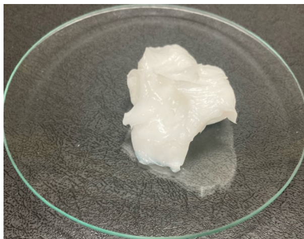
Figura 1. A. Avaliação macroscópica do creme não iônico. B. Avaliação macroscópica do creme Lanette®.

Lanette® desenvolvidos apresentaram aspecto homogêneo, branco e odor característico (6).