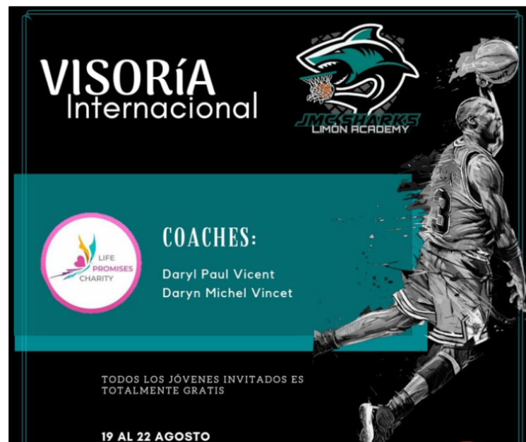
Figura 3. Cartel de visoria deportiva internacional convocada por LPC de Costa Rica bajo el Proyecto Mariposa

A continuación, se aportan dos imágenes relacionadas con los procesos vinculados con el Proyecto Mariposa y la incidencia que han tenido en la gestión de iniciativas con población infantil en condición de vulnerabilidad social y económica en territorio costarricense.