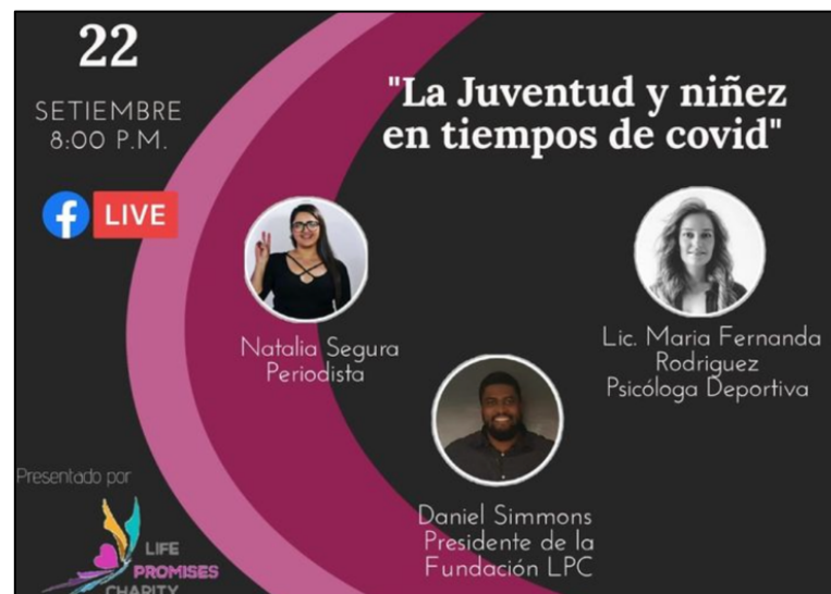
Figura 4. Cartel de invitación al Webinar: «La juventud y niñez en tiempos de COVID»