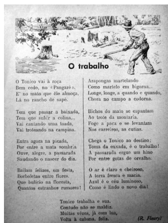
Figura 5 – O trabalho

Morais: família, crenças religiosas, conduta moral, como consta na Figura 5: