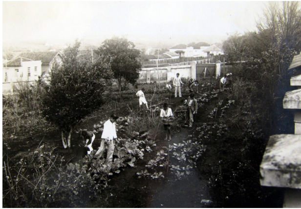
Figura 7 – Clube Agrícola do Grupo Escolar de Itararé.