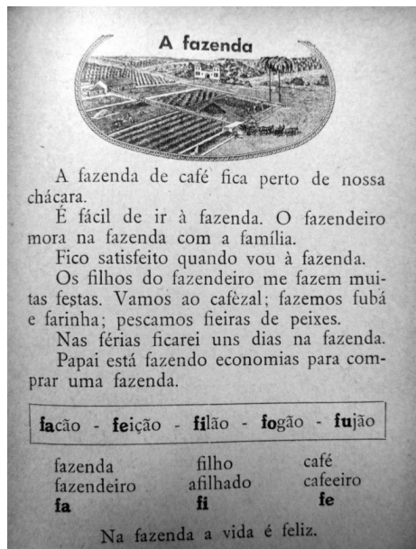
Figura 1 – A fazenda

Econômicos: fixação das populações rurais, aumento da riqueza, como consta na Figura 1: