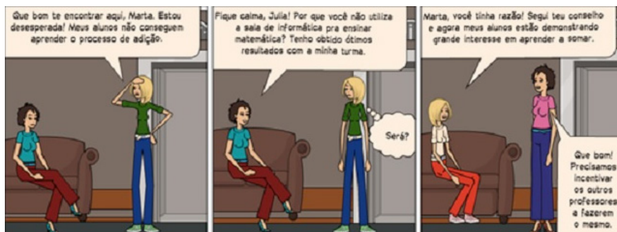
Figura 2 – ¿Cómo debemos enseñar? (Historieta creada por los practicantes por la página web Pixton ([HQ 2])