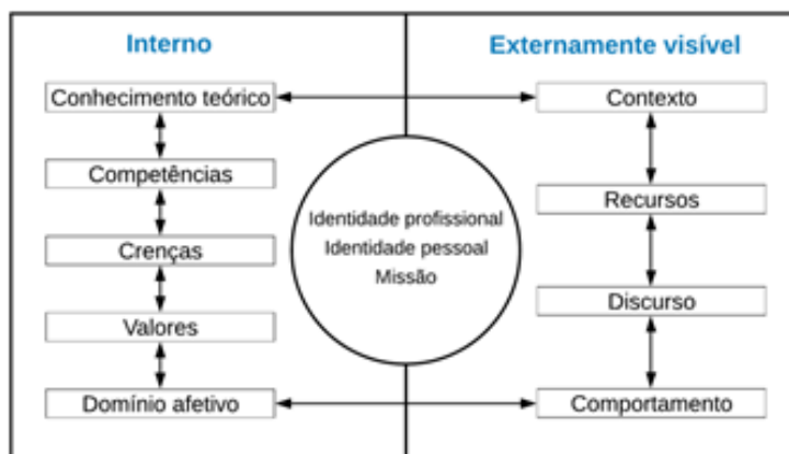
Figura 1 Modelo de campo de Futebol sobre a identidade pessoal e profissional e sua missão do professor.