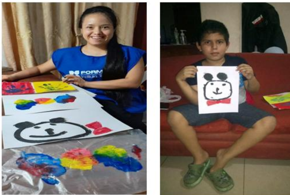
Imagen 5. Dos integrantes mostrando su trabajo.