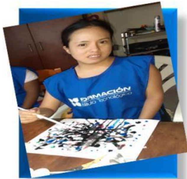
Imagen 1. Una de las integrantes ejecutando su trabajo.