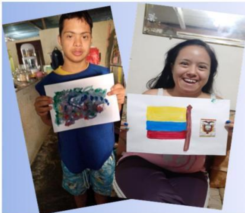
Imagen 3. Dos integrantes mostrando su trabajo.