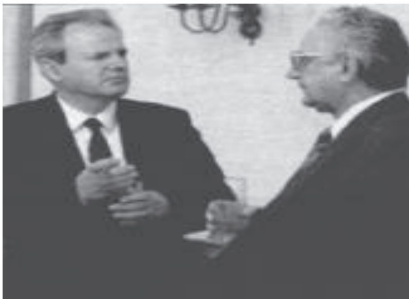
Prilog 1. Milošević i Tuđman u Karađorđevu 26. 3. 1991. godine.

Razgraničenje u Bosni i Hercegovini ćemo napraviti zbog toga što to odgovara Srbiji i Hrvatskoj podjednako, a muslimanska komponenta zapravo i nema drugog izlaza osim da prihvati to rješenje.