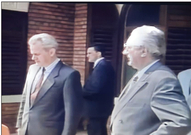
Prilog 3. Milošević i Tuđman u Tikvešu 15. 4. 1991.

Ova mogućnost utjecala je na Tuđmana koji je otvoreno počeo da iskazuje bojazan u pogledu mogućeg stvaranja srpsko-muslimanskog saveza, ukoliko bi Muslimani odlučili da ostanu u Jugoslaviji. Kalkulišući sa tom mogućnošću on je smatrao da bi jedan takav razvoj događaja otvorio pitanje „onog dijela hrvatskog naroda koji živi izvan Republike Hrvatske“. Da je sa ovakvim razvojem situacije Tuđman ozbiljno računao svjedoči i njegov sastanak sa predstavnicima hrvatskog naroda iz Bosne i Hercegovine, na kojem je rečeno sljedeće: 15