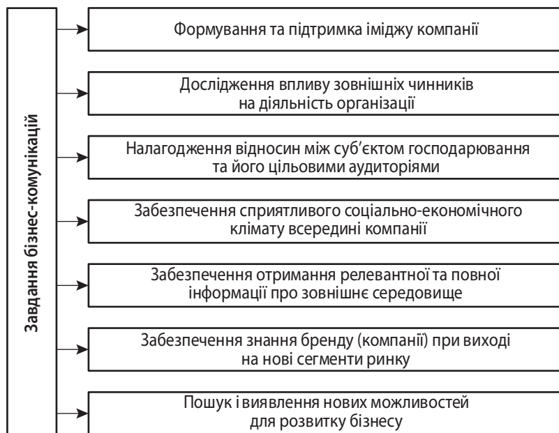
Рис. 2. Основні завдання бізнес-комунікацій