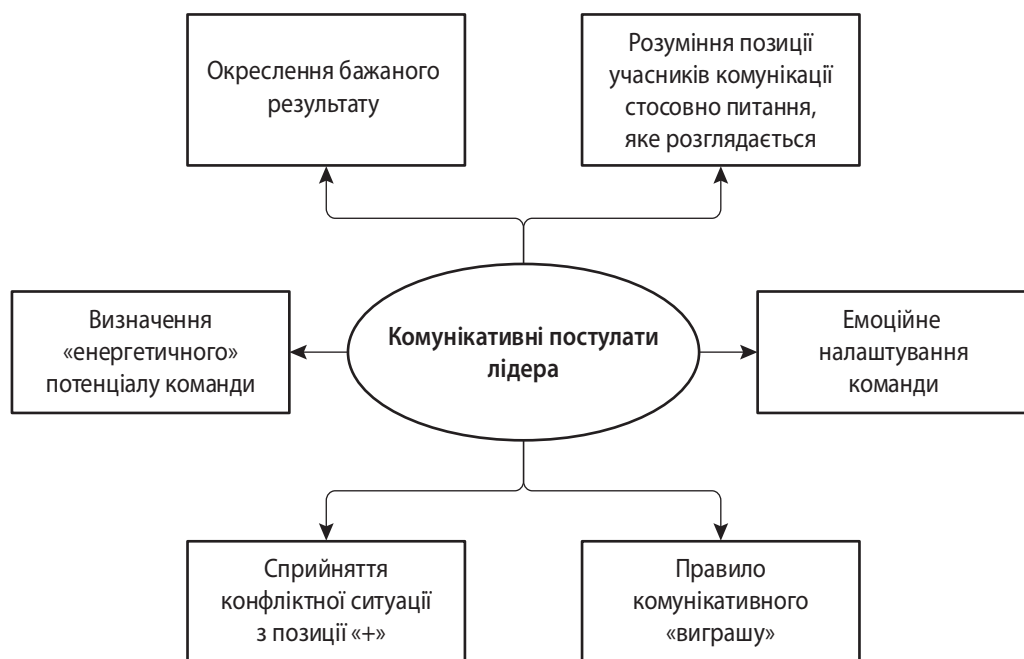
Рис. 1. Постулати якісної комунікації лідера

Визначення «енергетичного» потенціалу команди передбачає розуміння рівня зацікавленості співробітників в ефективній комунікації. На основі оцінки даного потенціалу можна сформулювати оптимальні шляхи міжособистісної взаємодії в колективі, що приведе до позитивного ефекту при використанні професійних компетентностей членів команди.