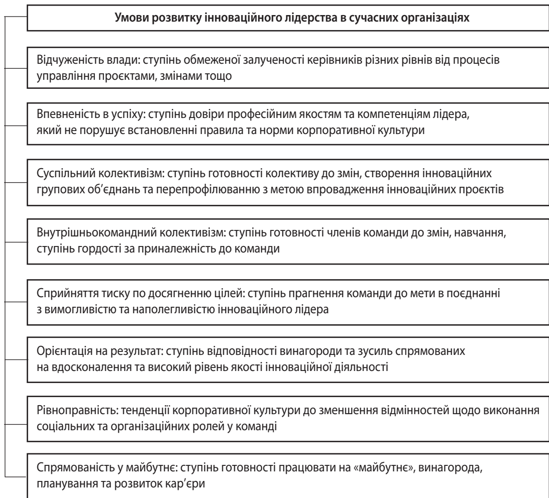
Рис. 3. Умови розвитку інноваційного лідерства в сучасних організаціях